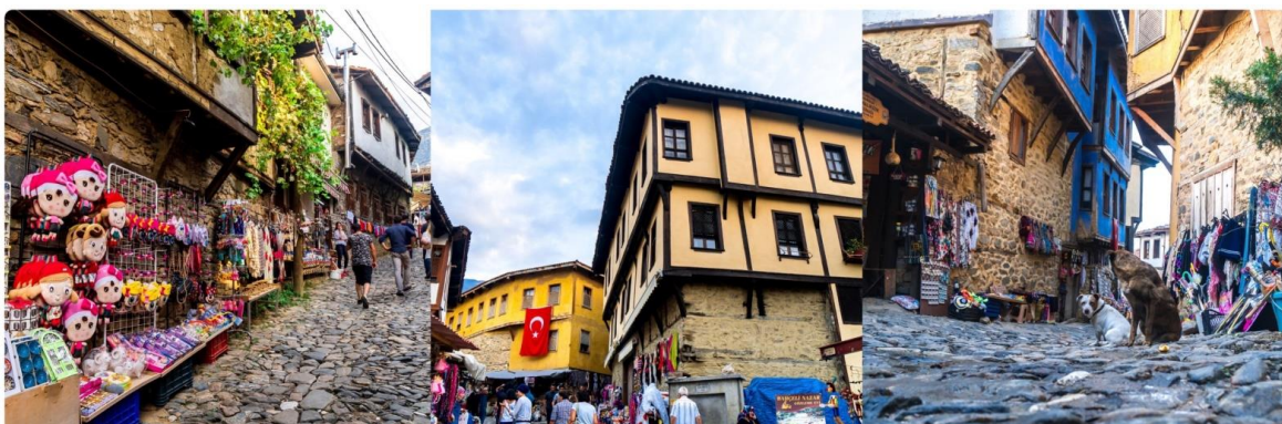
หน้า 15 (ภาพใช้เพื่อการโฆษณาเท่านั้น)

จากนั้นให้ท่านได้สัมผัสบรรยากาศใหม่ ไม่เหมือนใครกับการชมเมืองอิสตันบูล รูปแบบสไตล์เมืองเก่า นั่นคือ ย่าน FENER & BALAT ชุมชนชาวฮิวเก้เก่าแก่ กว่า 100 ปี ที่อาศัยอยู่ในเขตเมืองเก่าของกรุงอิสตันบูล โดยอยู่ฝั่งบริเวณเขตยุโรป ท่านจะได้สัมผัสความคลาสสิกของตึกเก่า ที่ปลูกสร้างตามแนวสันเขาเล่นระดับแบบมีเอกลักษณ์ และที่สำคัญยังสวยงาม ด้วยสีส้มสดใส สะดุดตา น่ามอง จนทำให้เกิดเป็นมุมถ่ายรูป ชิคๆ เก๋ๆ มากมายในเขตชุมชนแห่งนี้ และน่าแปลกใจเป็นอย่างมาก เนื่องจากความสงบเงียบ และ