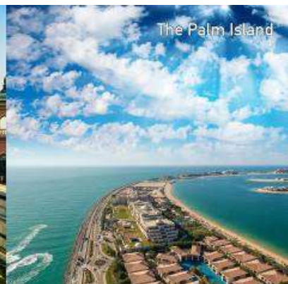
The Palm Island