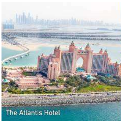
The Atlantis Hotel

นำท่าน นั่งรถไฟ MONORAIL > เดินทางสู่โครงการเดอะปาล์ม THE PALM ซึ่งเป็นโครงการที่อลังการ สุดยอดโป้ร เจดส์โดยการถมทะเล ให้เป็นเกาะเทียมสร้างเป็นรูปต้นปาล์ม 3 เกาะ บนเกาะมีที่พักโรงแรม รีสอร์ท อพาร์ทเมนต์ ร้านค้า ภัตตาคาร รวมทั้งสำนักงาน ต่าง ๆ นับว่าเป็นสิ่งมหัศจรรย์อันดับ 8 ของโลก