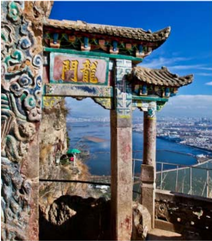
ประตูมังกร

เทพกวนอู นอกจากเป็นเทพเจ้าแห่งความซื่อสัตย์แล้ว คนจีนยังเชื่อว่ากวนอูเป็นเทพเจ้าแห่งโชคลาภและความร่ำรวย โดยให้ไหว้อิฐฐาน จากนั้นแล้วลูบก้อนทองในมือกวนอู แล้วจึงล้วงมือเข้าไปในปากปีเซี่ยะ 3 ครั้งกำมือแล้วนำเข้ามาใส่กระเป๋าพร้อมมรดกชีพ