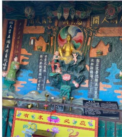
เจ้าแม่กวนอิม