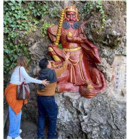
เทพเจ้ากวนอู