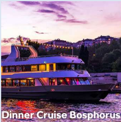
Dinner Cruise Bosphorus

ล่องเรือไปตามช่องแคบบอสฟอรัส ช่องแคบที่เป็นพรมแดนกั้นระหว่างทวีปยุโรปและทวีปเอเชียบรรยากาศริมสองฝั่งแม่น้ำ ที่ภูมิสถาปัตยกรรมมีความแตกต่างกันอย่างเห็นได้ชัดระหว่างกลิ่นอายของยุโรป และกลิ่นอายความเป็นเอเชีย ระหว่างการล่องเรือ จะได้ชมเมืองที่มีชีวิตชีวาด้วยแสงไฟสว่างไสวในยามค่ำคืน พร้อมรับชมการแสดงโชว์วัฒนธรรมการตา